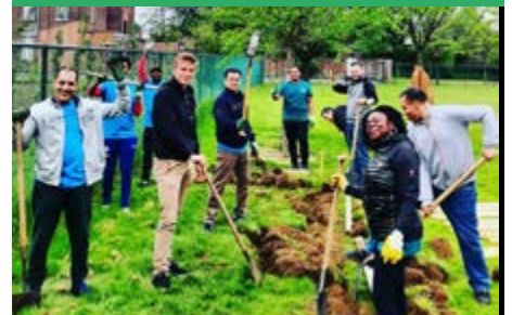
Samen met de buurt werkten we aan de Kloostertuin.